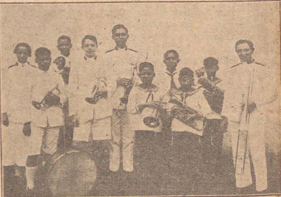
Ons eerste J. L. Muziekkorps.